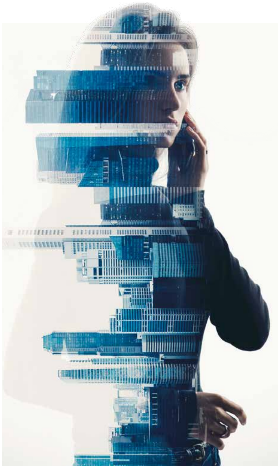
Führungspersönlichkeiten dürfen sich heute nicht mehr hinter ihren Hierarchien verstecken.

Verabschieden müssen sich die Digital Leader von morgen zudem von der Fiktion: Veränderungen sind in der VUCA-Welt langfristig und im Detail planbar. In ihr gilt es, wenn grosse oder weitreichende Veränderungen anstehen oder langfristige (Entwicklungs-)Ziele erreicht werden sollen, vielmehr ähnlich wie beim klassischen Lean Management vorzugehen, das auf eine kontinuierliche Verbesserung abzielt: also ausgehend von einer vorläufigen Planung die ersten Schritte tun. Dann evaluieren: «Erzielen wir durch die Massnahmen die gewünschte Wirkung, bewegen wir uns in die angestrebte Richtung?» Und dann abhängig vom Ergebnis, den Kurs entweder korrigieren oder den eingeschlagenen Weg weitergehen. Das setzt voraus, dass die Führungskräfte in einem regelmässigen, von wechselseitigem Vertrauen geprägten Meinungs- und Informationsaustausch mit ihren Mitarbeitern stehen