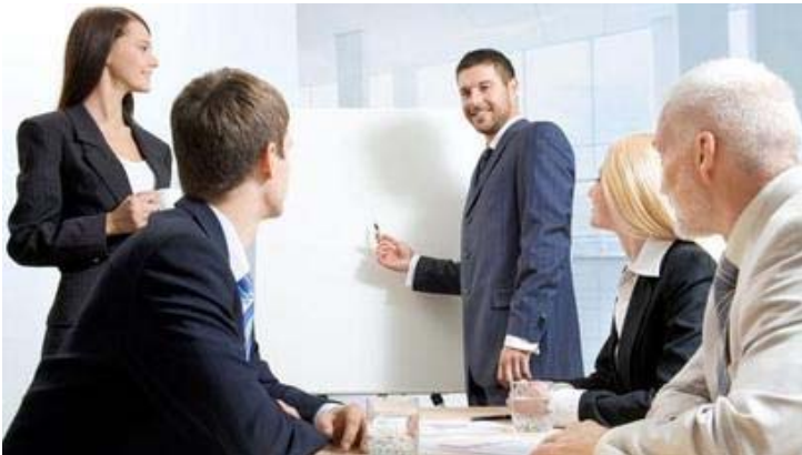
Die Unternehmensberatung steckt im Wandel

Die meisten Veränderungen nicht nur im Beratungsmarkt verlaufen schleichend. Berater müssen sich vor allem auf einen Megatrend einstellen: Die Hierarchien der Unternehmen werden flacher.